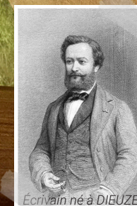
Écrivain né à DIEUZE